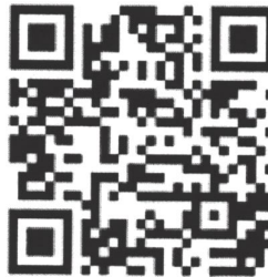
Рисунок 6 — Рекомендации по проведению кинопоказов в профилактике

Среди фильмов по тематике противодействия терроризму можно использовать следующие фильмы: «Беслан. Память» (Россия, 2014 г., возрастное ограничение: 12+), «Кавказский пленник» (Россия, 1996 г., возрастное ограничение: 18+), «Я не террорист» (Узбекистан, 2021 г., возрастное ограничение: 18+), «Отель Мумбаи: противостояние» (США, Австралия, 2018 г., возрастное ограничение: 18+) и т.д.