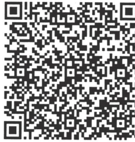
Рисунок 7 — Сценарий тематической викторины с примерами вопросов

В каждом из перечисленных мероприятий важно отслеживать активность участников, высказываемыми ими мнения, их настрой в целом. На таких мероприятиях необходимо присутствие психолога для фиксации активности и оценки их поведения.