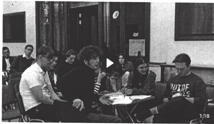
Дебаты «Идеология радикальных организаций» 1 888 просмотров

В рамках дебатов можно: развенчивать мифы, декларируемые представителями радикальных идеологий для вербовки; развивать навыки критического мышления и ведения дискуссии; формировать в целом антитеррористическое сознание и активную гражданскую позицию. Рекомендуется для мероприятия вовлекать не более 20 человек (см. рисунок 5).