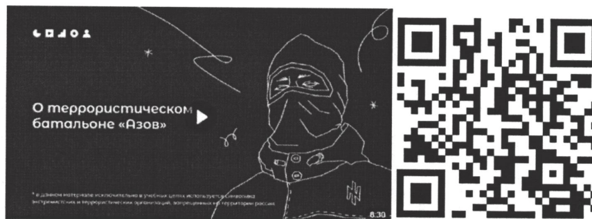
Рисунок 2 – Видеоролик, разъясняющий причины признания организации террористической

3) батальон «Азов» (см. рисунок 2) — военизированное подразделение, созданное в 2014 году на базе футбольных ультрас и праворадикалов Харькова и некоторых других украинских регионов. «Азовцы» причастны к массовым военным преступлениям против мирного населения Донбасса и Украины. Сама организация признана террористической в России по решению Верховного Суда Российской Федерации от 02.08.2022 г. № АКПИ22-411С. Батальон «Азов» входит в состав Национальной гвардии, подчиненной Министерству внутренних дел Украины. С 2014 года боевики батальона «Азов» систематически пытали, убивали и грабили мирных жителей ДНР, ЛНР и востока Украины. У батальона неонацистская идеология. Это проявляется в расизме, русофобии, восхвалении наследия Третьего рейха и украинских коллаборационистов в годы Второй мировой войны. Среди боевиков в том числе распространены радикальные неоязыческие взгляды. Свою идеологию боевики активно распространяют среди украинской молодежи через лагеря подготовки, печатную продукцию (комиксы, книги) и интернет-сообщества. С «Азовом» активно сотрудничает большое количество праворадикальных течений на Украине (признанных в России экстремистскими организациями), например, «Правый сектор», «УНА-УНСО», организация «Тризуб им. Степана Бандеры» и т.д.