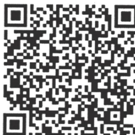
Рисунок 4 — Сценарий для проведения дебатов «Идеология радикализма»

Первая команда всегда будет представлять сторону радикальной идеологии. Задача команды студентов – найти контраргументы тех радикальных и спорных тезисов, которые будет озвучивать первая команда. Тем самым, участники будут вынуждены критически рассматривать постулаты радикальных идеологий, искать в них логические ошибки, несоответствия – самостоятельно приходить к выводу о деструктивности любой радикальной идеологии (см. рисунок 4).