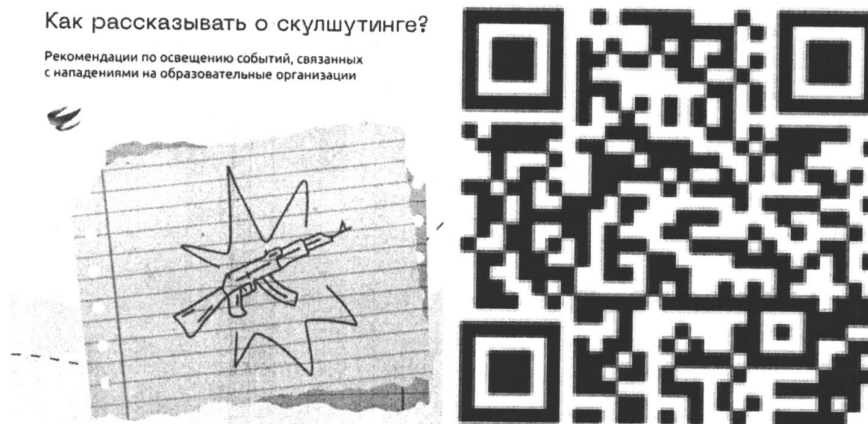
Рисунок 1 — Рекомендации по освещению в СМИ темы скулшутинга

1) «Колумбайн» (другое название «Скулшутинг») — террористическая организация, признанная таковой по решению Верховного Суда Российской Федерации от 02.02.2022 г. № АКПИ21-1059С. Идейная основа – ненависть в отношении образовательных организаций, преподавателей и обучающихся, а также прославление нападавших ранее на образовательные организации. За последние 5 лет в России участились случаи нападений учащихся на учебные заведения. Во многих случаях «скулшутинга», нападавшие в определённой степени копировали сценарий преступления, совершенного в 1999 году учениками школы «Колумбайн» - Э. Харрисом и Д. Клиболдом, а также сценарии других нападений, совершенных уже в России (например, нападение В. Рослякова в 2018 году на Керченский политехнический колледж). Следует помнить, что одна из причин скулшутинга – травля со стороны обучающихся и учителей. Часть нападавших ранее подвергались насилию в классе, группе и в образовательной организации в целом. Поэтому руководству образовательных организаций следует уделять большое внимание ранней диагностике проблем и профилактической работе. Отдельно следует решать важный вопрос недостаточного внимания родителей к проблемам несовершеннолетних (см. рисунок 1).