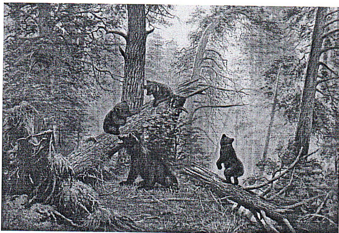
«Утро в сосновом лесу»