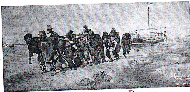
«Бурлаки на Волге»