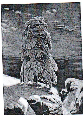
«На севере диком»